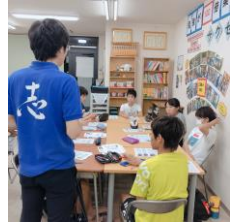
夏休み通い合宿の様子