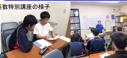
英数特別講座の様子