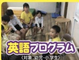
英語プログラム (対象: 幼児・小学生)

「読み・書き・計算」を繰り返し勉強することで、基礎学力を身につけ、自学自習の習慣付けを促します。