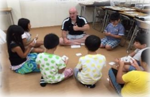
ネイティブの先生と英会話も やるよ!