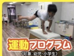
運動プログラム (対象: 幼児・小学生)

Annie Jr.イングリッシュの質の高いレッスンプログラムを毎日受講できます。