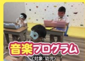
音楽プログラム (対象: 幼児)

「走る」「跳ぶ」「投げる」「蹴る」などの基本的な動きをバランスよく組み入れ、「体の力」を育てます。