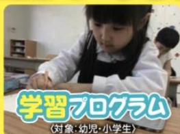
学習プログラム (対象: 幼児・小学生)

「読み・書き・計算」を繰り返し勉強することで、基礎学力を身につけ、自学自習の習慣付けを促します。